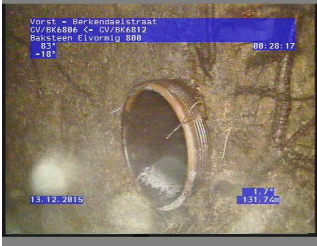
Présence de racines dans l'égout principal, mettent en péril sa structure même.