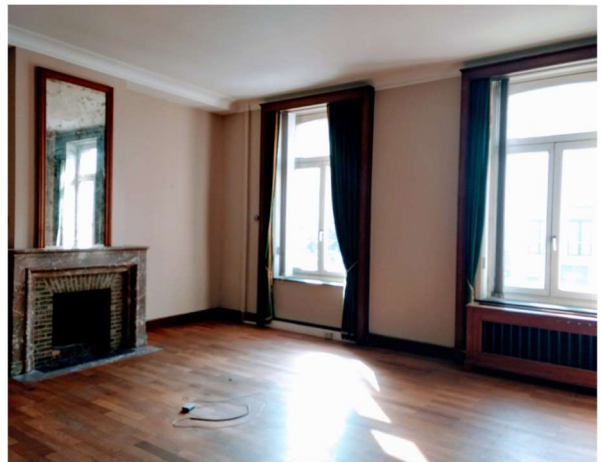
Vue intérieure de la situation existante - ancienne Fortis - 1 er étage | 2017