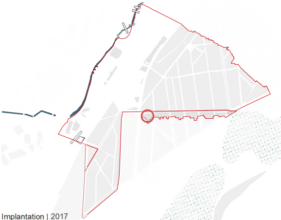
Implantation | 2017

1-11 , AV. WIELEMANS CEUPPENS 1190 | FOREST