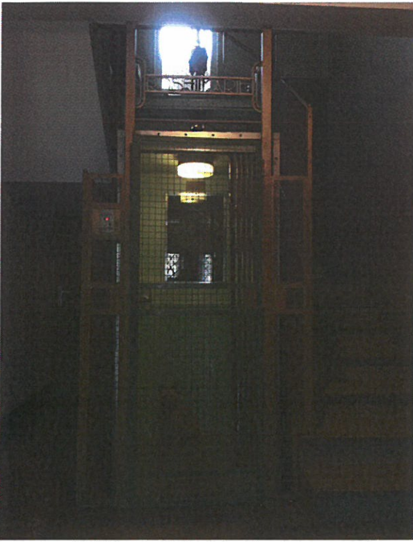
Ascenseur Schlieren Schaerbeek non-renové