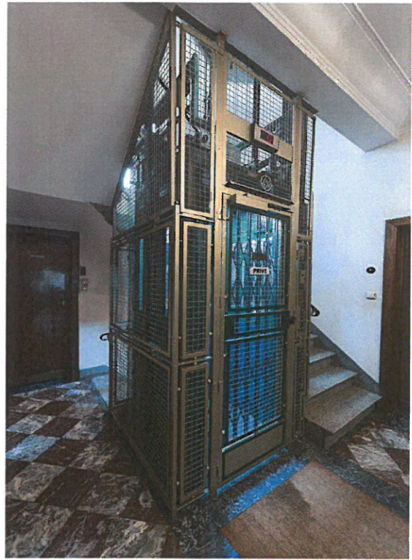
Ascenseur Schlieren Schaerbeek Renové Prix Patrimoine Commune de Schaerbeek