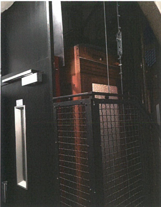
Place Brugman Type-Schlieren rénové Sans respects pour les aspects patrimoniale