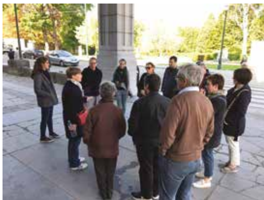
Fête de l'Iris à Forest- 06 mai 2017 Irisfeest in Vorst- 06 mei 2017