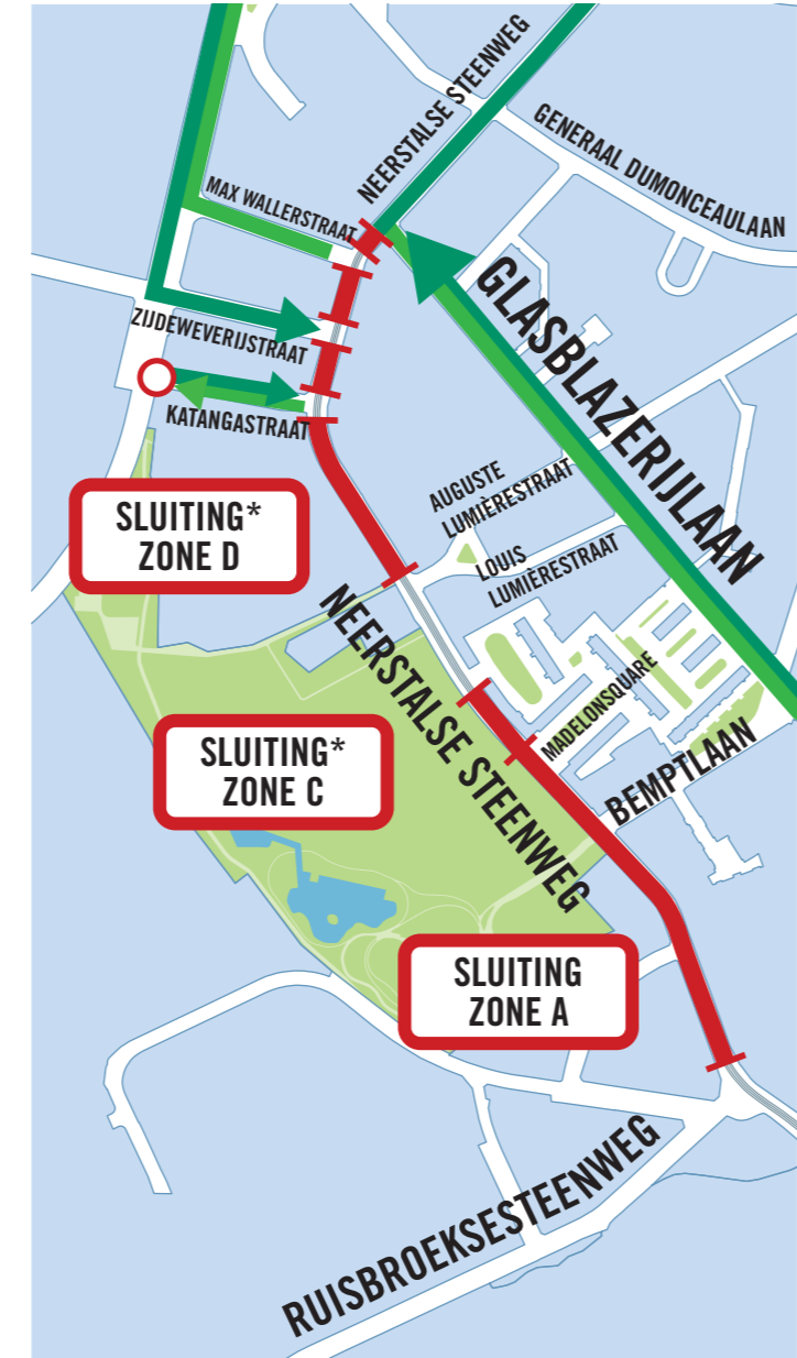
* sluiting met lokale toegang

› Tussen de Lumièrestraat en de Glasblazerijlaan zal Vivaqua van kruispunt tot kruispunt werken, waarbij er steeds een mogelijkheid blijft om lokaal de Neerstalsesteenweg in of uit te rijden.